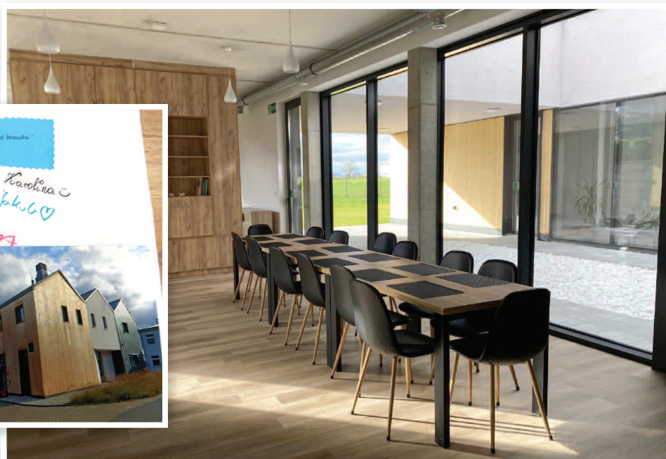
Przestronna jadalnia. Placówka opiekuńczo-wychowawcza w Nysie