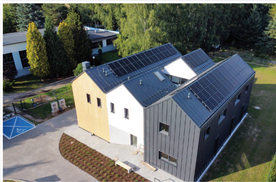
Placówka opiekuńczo-wychowawcza w Otmuchowie

Dwie placówki udało się wybudować dzięki środkom finansowym, które Powiat Nyski pozyskał z Rządowego Funduszu Polski Ład: Programu Inwestycji Strategicznych, w wysokości 4 250 000 zł. Reszta kwoty pochodzi ze środków własnych Powiatu. Koszt całego przedsięwzięcia inwestycyjnego wyniósł 7 619 655, 12 zł.