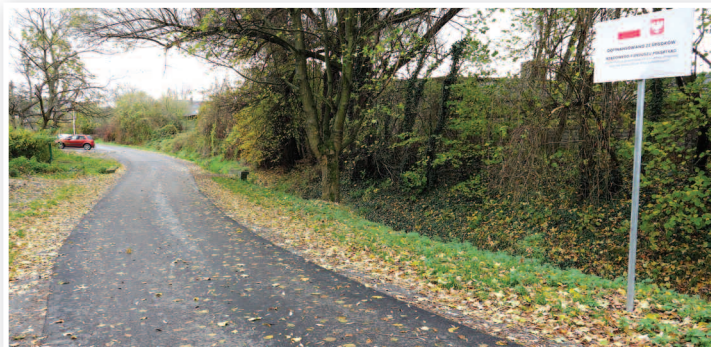
DP 1621 O Bodzanów