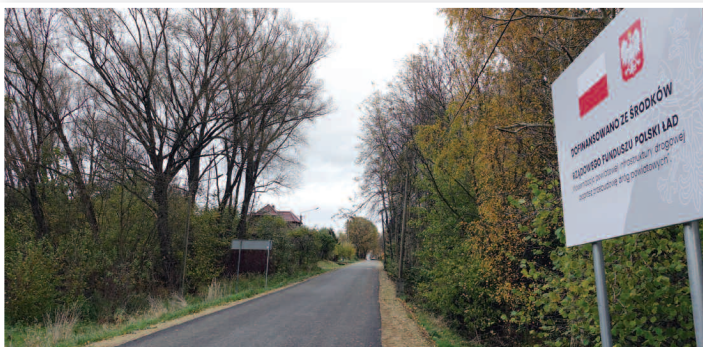
DP 1609 O Nowy Świątów - Stary Las