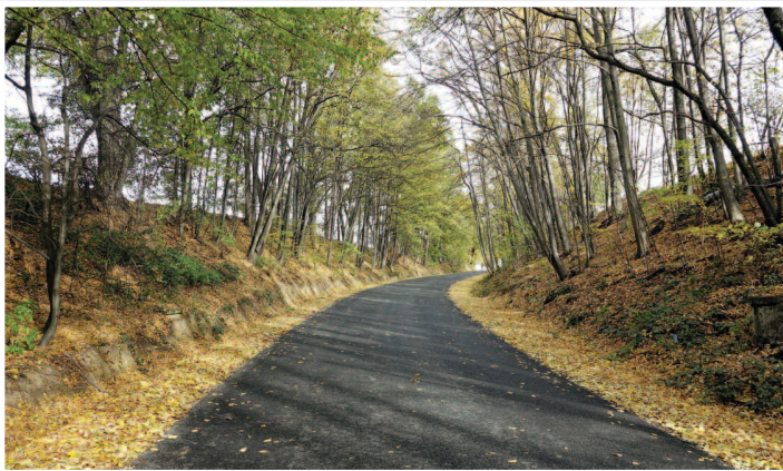
DP 1633 O Jodłów - Łąka