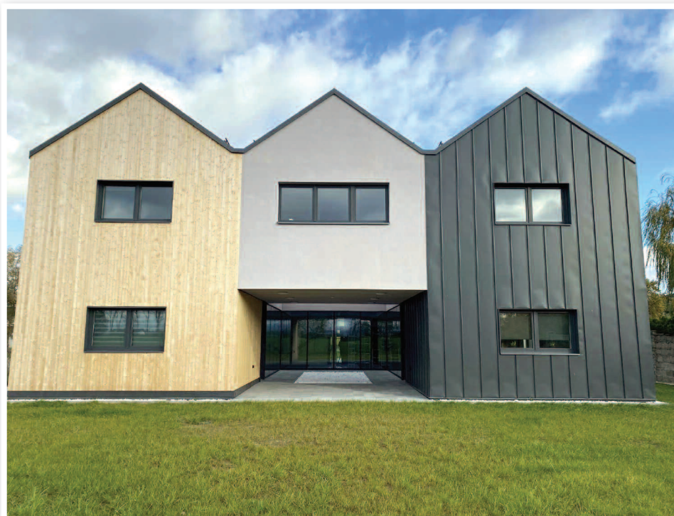
Placówka opiekuńczo-wychowawcza w Nysie

Placówki opiekuńczo-wychowawcze w Nysie oraz Otmuchowie to nowoczesne obiekty stwarzające klimat domu rodzinnego. Samorząd powiatu uczynił wiele starań, by warunki dla najmłodszych były jak najlepsze. Budynki spełniają najwyższe kryteria, aby dzieci mogły się tam dobrze czuć i rozwijać. Do dyspozycji wychowanków są między innymi przytulne pokoje dwuosobowe w pełni wyposażone w nowe meble i wszelkie sprzęty potrzebne do codziennego życia, kuchnia z jadalnią, gdzie dzieci będą uczyły się przygotowywać posiłki. Salon do wspólnego spędzania czasu. Kolejnym wyróżnikiem są energooszczędne technologie zastosowane w procesie budowy. W obu obiektach zamontowano panele fotowoltaiczne, rekuperator, pompy ciepła. Dzięki temu koszty użytkowania budynków zmniejszą się, a zaoszczędzone w ten sposób środki placówki mogą przeznaczać na potrzeby swoich podopiecznych. Wokół obiektów znajduje się też teren zielony, latem pojawiają się tam meble ogrodowe, huśtawka i inne wyposażenie umożliwiające podopiecznym wypoczynek.