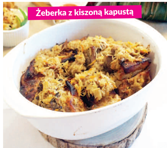
Żeberka z kiszoną kapustą