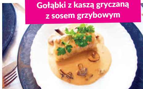
Gołąbki z kaszą gryczaną z sosem grzybowym