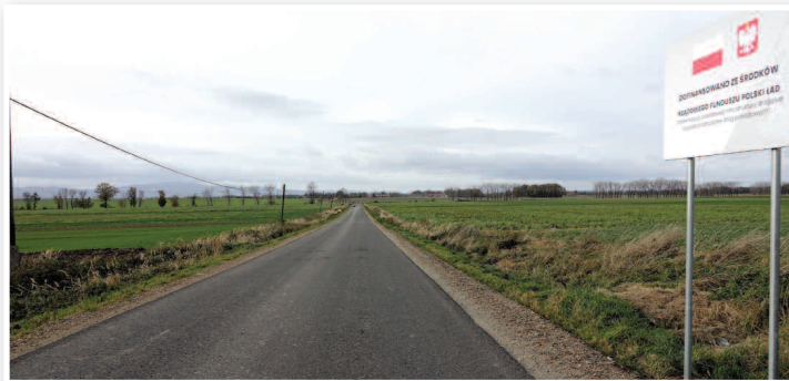
DP 1637 O Kałków - Piotrowice Nyskie