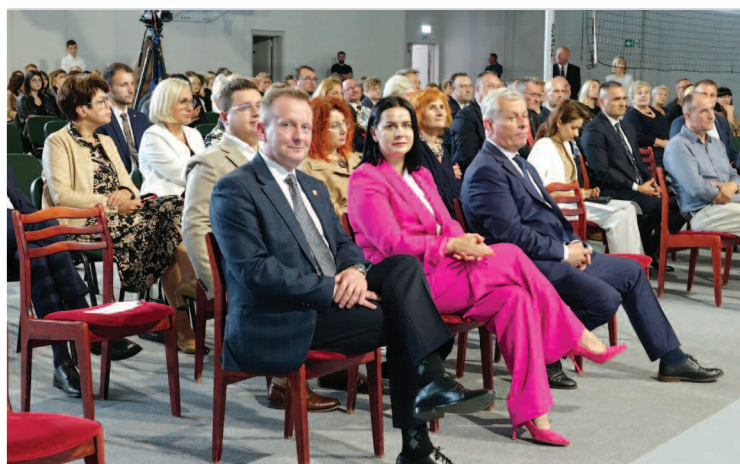
Uroczystość otwarcia sali uświetniło wielu gości