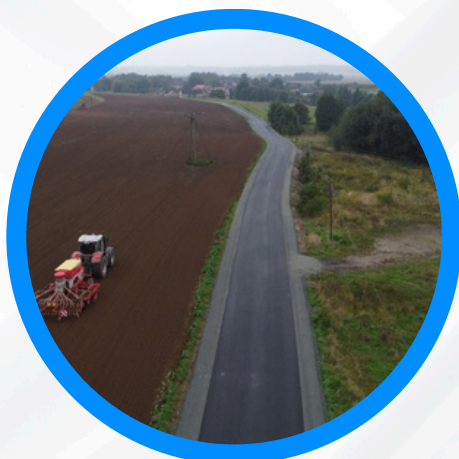
Remont drogi powiatowej relacji Kubice-Domaszkowice