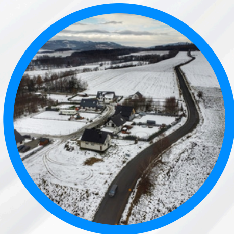
Remont drogi powiatowej relacji Głuchołazy-Podlesie