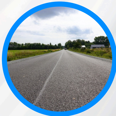
Remont drogi powiatowej relacji Siostrzechowice-Koperniki