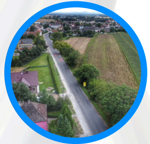
Chodnik i zatoczka autobusowa w Bielicach