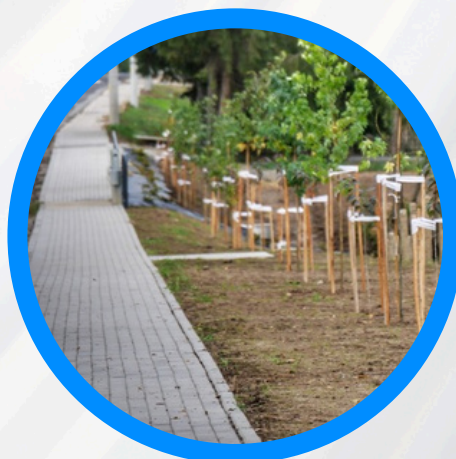
Chodnik i zatoczka autobusowa w Goworowicach