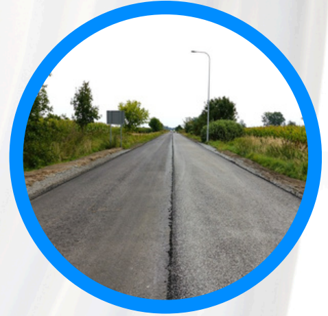
Remont drogi powiatowej prowadzącej do Prusinowic