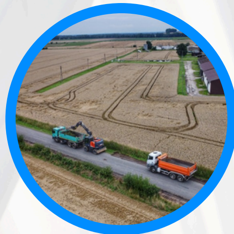
Remont drogi powiatowej relacji Meszno-Ratnowice