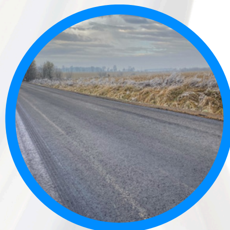
Modernizacja odcinka drogi powiatowej nr 1605 O na odcinku Myszwice-Wielkie Łąki oraz odcinka drogi powiatowej nr 1620 O do miejscowości Podlesie