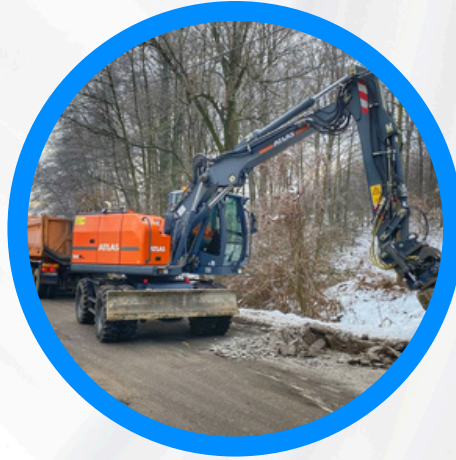
Remont drogi powiatowej w Iławie