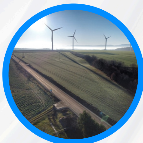
Remont drogi powiatowej nr 1654 O w pobliżu Lipnik (od miejscowości, w kierunku skrzyżowania z drogą prowadzącą do Paczkowa)