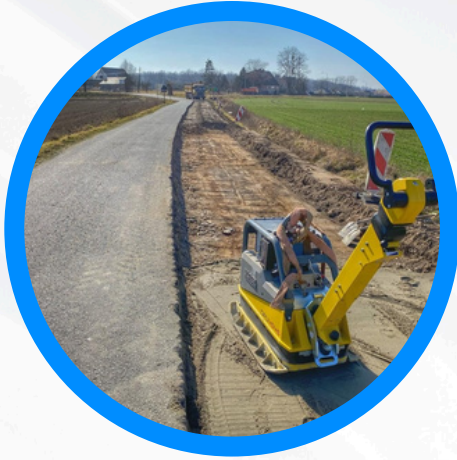
Remont drogi powiatowej relacji Kubice-Bardno