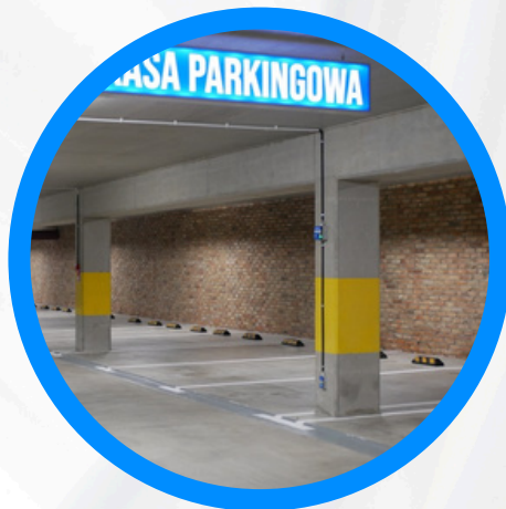
Remont parkingu podziemnego w Nysie przy ul. Piastowskiej