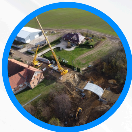
Przebudowa wiaduktu w ciągu DP 1669 O w miejscowości Karłowice Małe