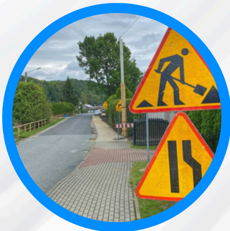
Chodnik w Jarnołtówku