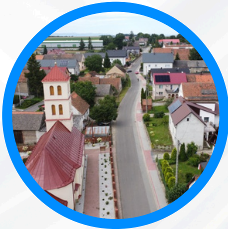
Chodnik w Węży