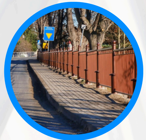
Nowe poręcze wzdłuż chodnika w Otmuchowie