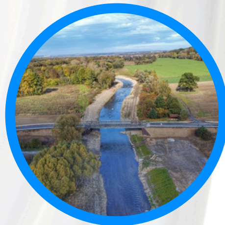
Odbudowa mostu w km 0+364 w ciągu DP 1624 O