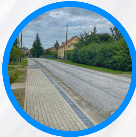
Chodnik w Wierzbiewicach