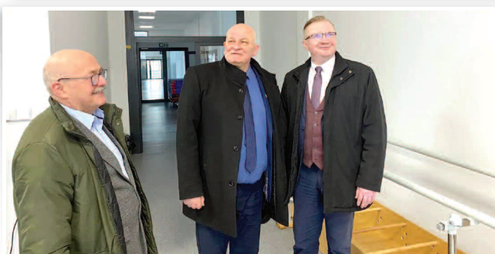
Andrzej Kruczkiewicz starosta nyski gościł na terenie naszego powiatu Tomasza Witkowskiego, wicewojewodę opolskiego. Wspólnie odwiedzili miejsca, w których dzięki rządowym środkom finansowym realizowane są kluczowe dla mieszkańców inwestycje.

Starosta wraz z wicewojewodą wizytowali m.in. ulicę Al. Wojska Polskiego, placówkę opiekuńczo-wychowawczą w Korfantowie. Przyglądali się również postępowi w pracach budowlanych sali gimnastycznej w ZSiPO w Nysie. Przy okazji wizyty w Korfantowie odwiedzili również studentów Uniwersytetu Trzeciego Wieku. (07.02.2023 r.)