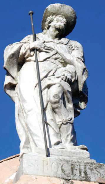
Kapliczka św. Rocha na Alei Wojska Polskiego w Nysie

Zaczyna się całkiem niewinnie, lekkim osłabieniem, gorączką, zawrotami i bólem głowy, później pojawiają się krwawe wymioty, delirium, utrata przytomności, na skórze zaczynają tworzyć się brązowe lub czarne plamy – stąd nazywana jest „czarną śmiercią”. Kiedy zarazki dostaną się do krwi ofierze pozostaje kilka godzin, najwyżej cztery dni życia a właściwie umierania w mękach. Dżuma.