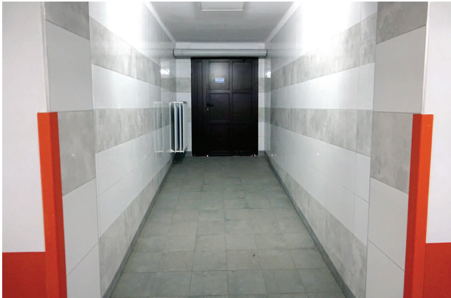
Remont korytarza Poradni Chirurgicznej