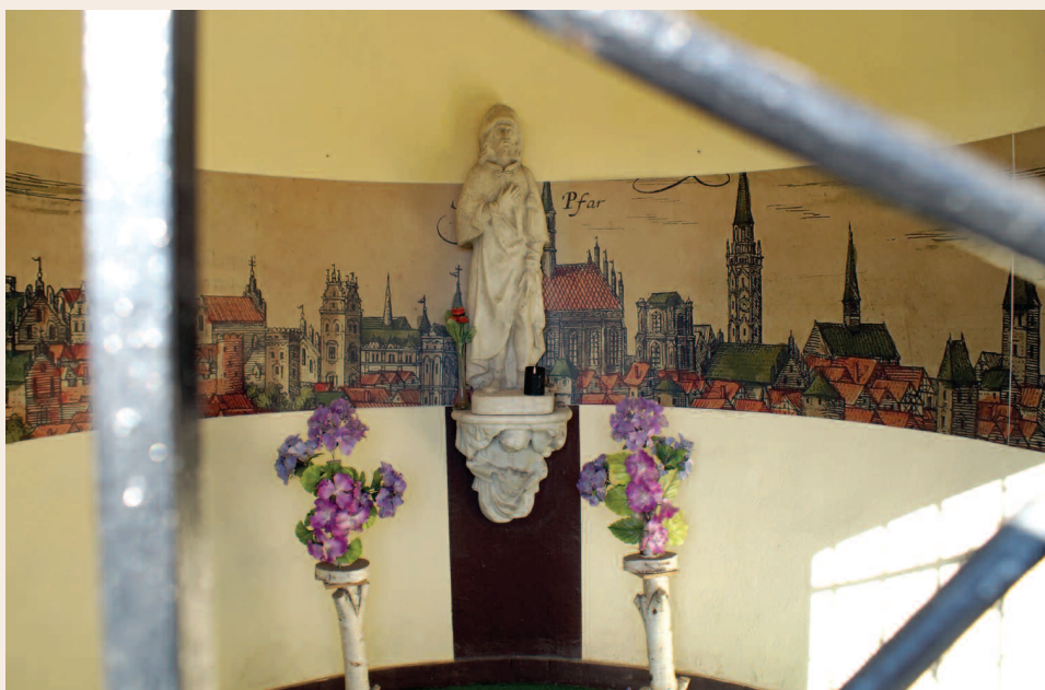
Kapliczka św. Rocha na Alei Wojska Polskiego w Nysie

Dlaczego zrozpaczeni mieszkańcy Nysy nie mogąc opanować rozprzestrzeniającej się z ogromną siłą epidemii dżumy udali się z procesją do kapliczki św. Rocha? Otóż św. Roch czczony był jako patron zadżumionych. Urodził się w roku 1295 w Montpellier (południowa Francja) jako syn bogatego szlachcica. W wieku 20 lat stracił rodziców i przejął ich cały majątek, który rozdał biednym i udał się na pielgrzymkę do Włoch. Kiedy dotarł do toskańskiego miasteczka Acquapendente, okazało się, że opanowała je dżuma. Roch z wielkim oddaniem poświęcił się opiece nad chorymi. To samo czynił także w innych miasteczkach. Wreszcie choroba zaatakowała jego samego, było to