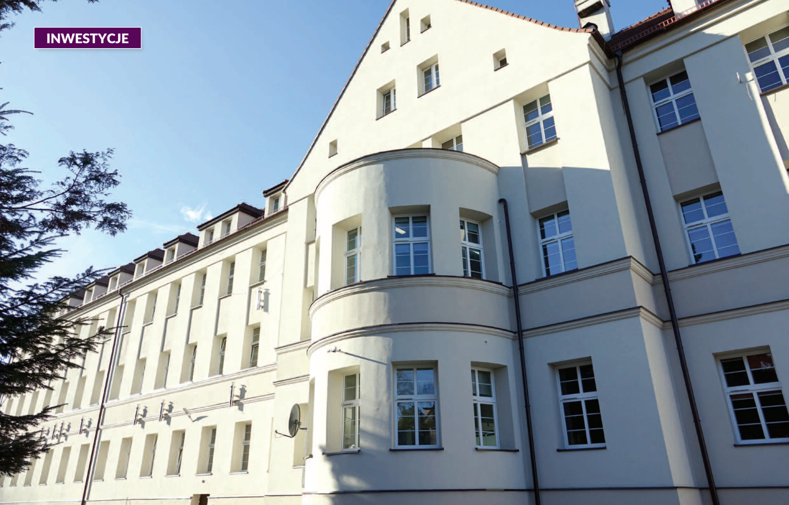
Prace termomodernizacyjne w budynku SP ZOZ ZOZ w Głuchołazach

chorób nowotworu układu oddechowego. W porównaniu do klasycznego zdjęcia RTG klatki piersiowej badanie TK pozwala precyzyjnie ocenić zmiany zapalne, pokazać zmiany niewidoczne w dotychczasowej klasycznej formie obrazowania płuc oraz uwidocznic zaawansowanie włóknienia w konsekwencji Covid-19. Ma to zasadnicze znaczenie w planowaniu leczenia i późniejszej rehabilitacji. Tomograf umożliwia diagnostykę i leczenie pacjentów na najwyższym poziomie. Pozwala sprawniej i szybciej diagnozować pacjentów w sytuacji, gdy lekarze muszą niemal natychmiast uzyskać informację o stanie chorego, by móc podjąć dalsze działania.