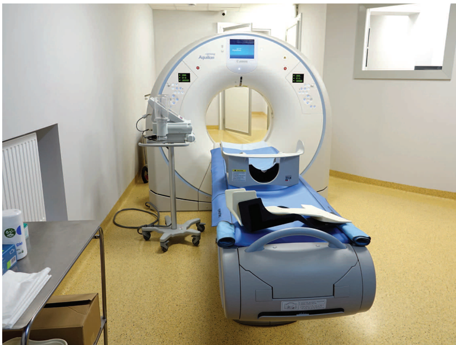
Pracownia tomograficzna w Głuchołazach