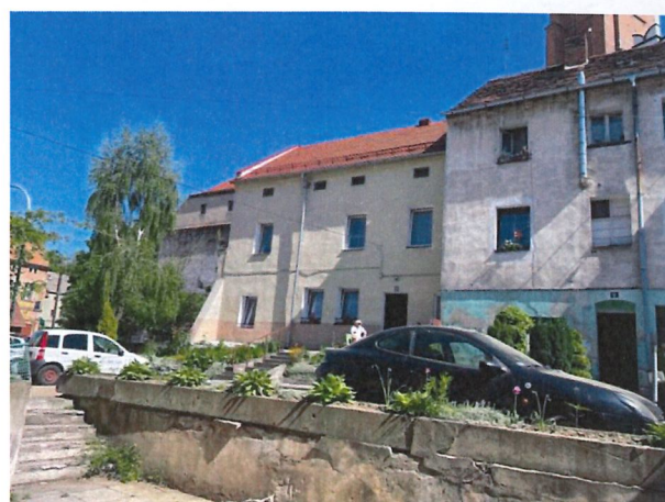
Zdjęcie 3 Sąsiedztwo nieruchomości