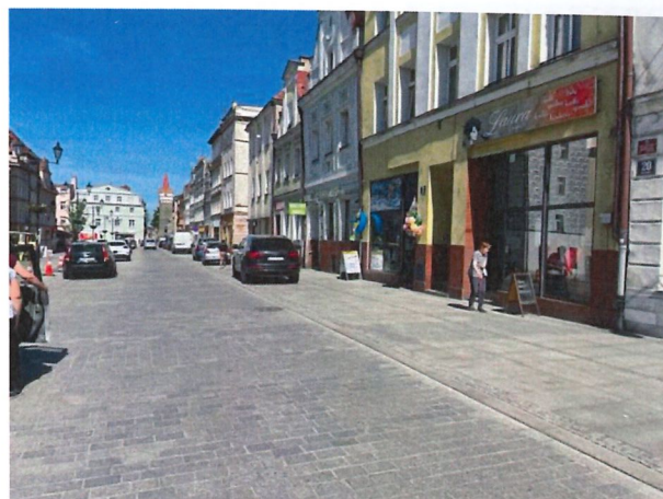
Zdjęcie 1 ul. Rynek