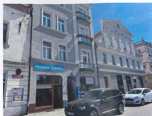
Zdjęcie 4 Sąsiedztwo nieruchomości