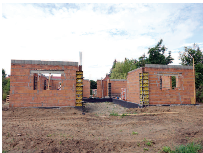
Budowa placówki opiekuńczo-wychowawczej w Otmuchowie