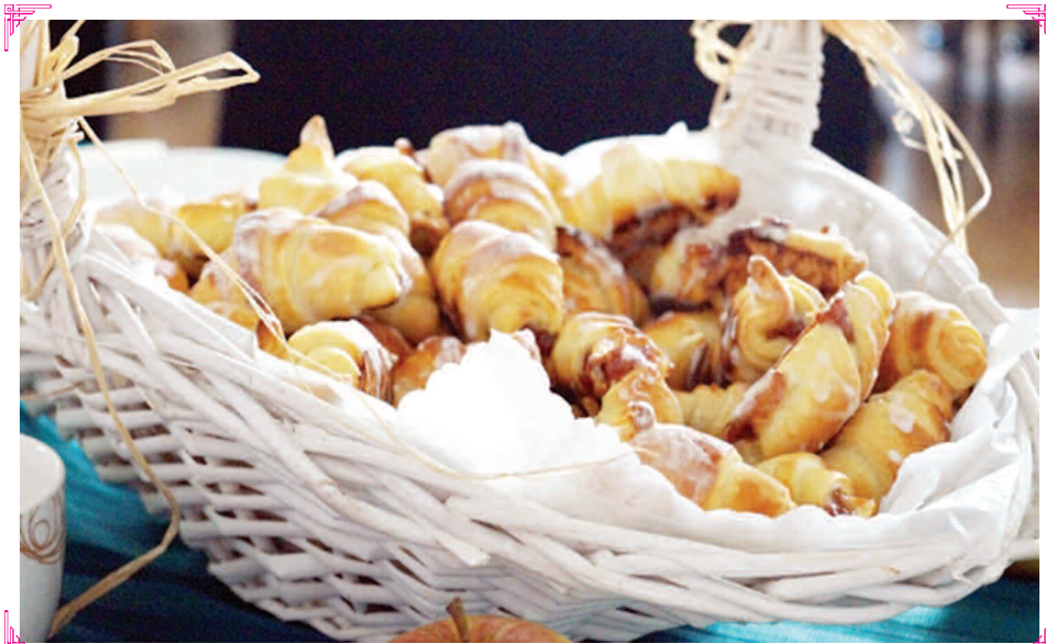
Rogaliki (Samodzielne Koło Gospodyń Wiejskich w Nowym Lesie)