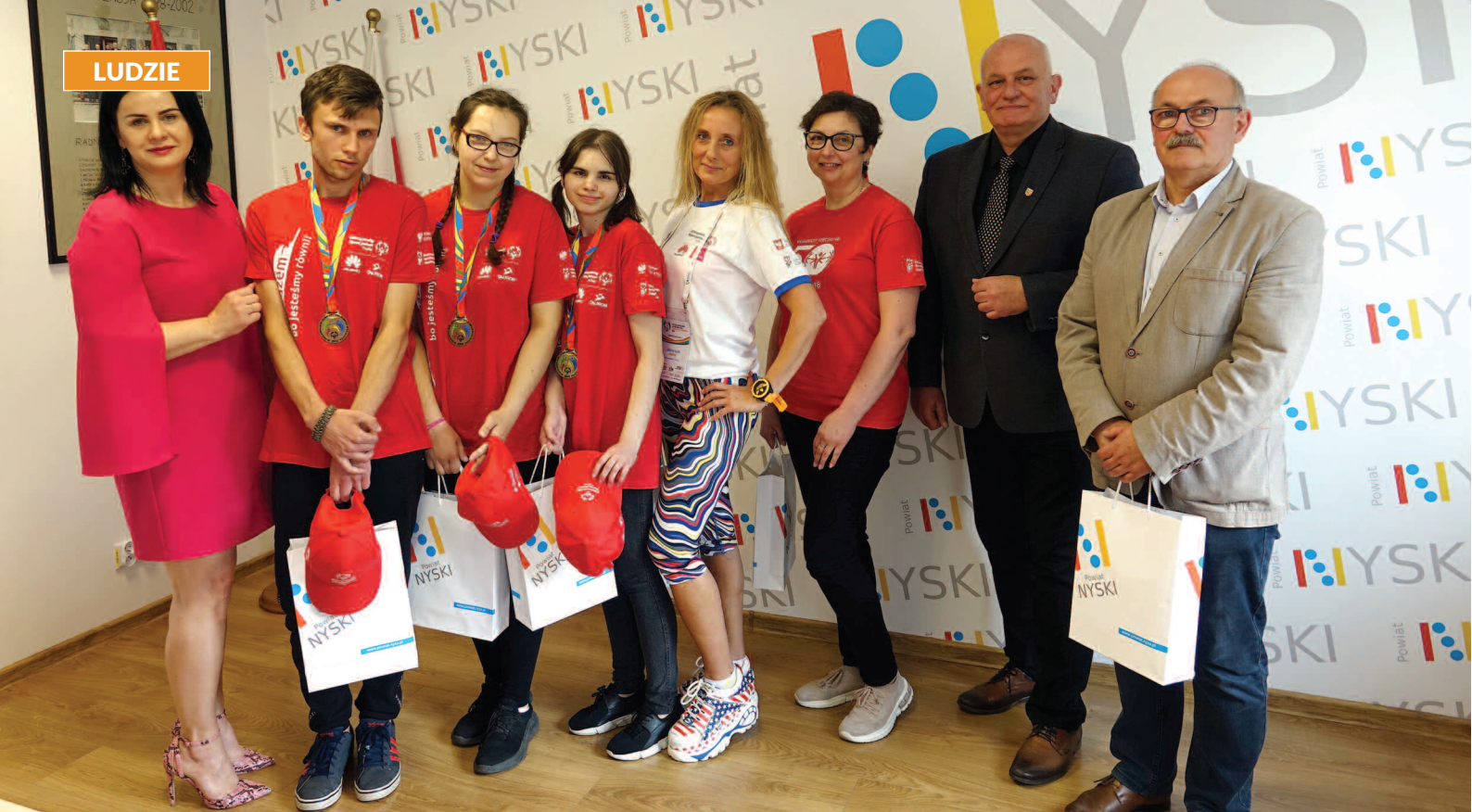
Uczniowie Zespołu Placówek Specjalnych w Nysie