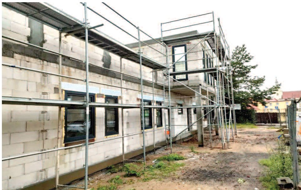
Budowa placówki opiekuńczo-wychowawczej w Korfantowie