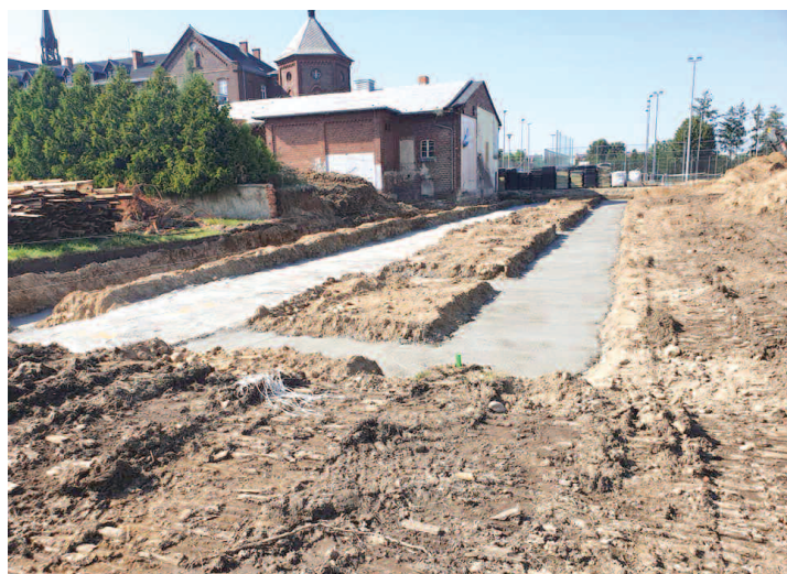
Budowa sali gimnastycznej w Zespole Szkół i Placówek Oświatowych w Nysie