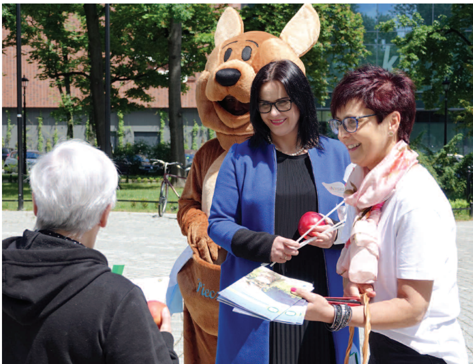
PCPR w Nysie prowadzi szereg akcji promujących ideę rodzicielstwa zastępczego

To nie takie trudne. Przede wszystkim odpowiedz sobie na pytanie, czy czujesz potrzebę pomocy innym, jesteś w stanie poświęcić dzieciom swoją uwagę i czas, dać im miłość oraz poczucie bezpieczeństwa? Kolejny krok to zgłoszenie się do Powiatowego Centrum Pomocy Rodzinie w Nysie. Tu opo-