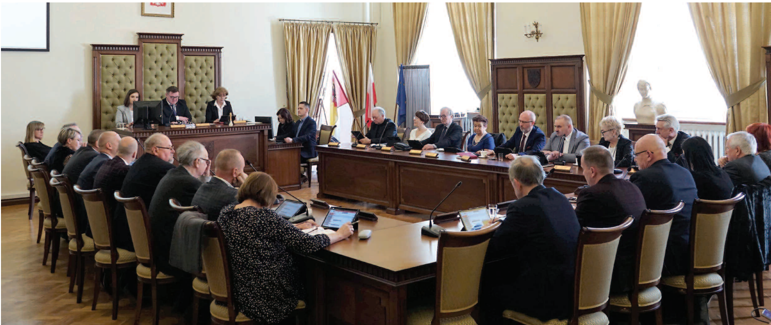
Rada Powiatu w Nysie

Rada powiatu jest organem stanowiącym i kontrolnym powiatu. Radni wybierani są w wyborach bezpośrednich, kadencja rady trwa 5 lat od dnia wyborów. W powiatach do 40 tys. mieszkańców w skład rady powiatu wchodzi 15 radnych oraz po dwóch na każde kolejne rozpoczęte 20 tys. mieszkańców, nie więcej jednak niż 29 radnych.