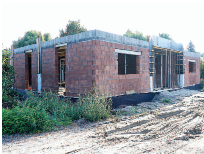
Budowa placówki opiekuńczo-wychowawczej w Nysie