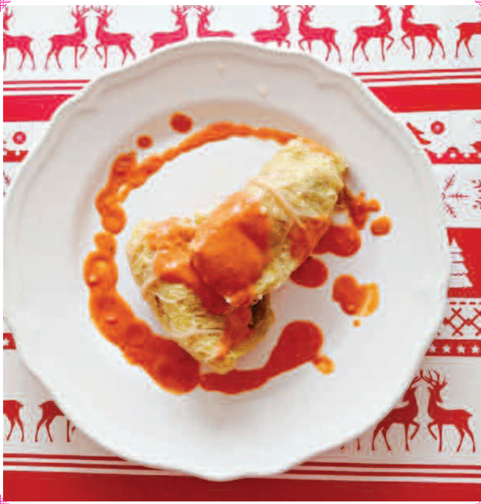
Gołąbki z grzybami (Koło Gospodyń Wiejskich w Pusznynie)

Piec w temperaturze 180 stopni do uzyskania złotego koloru.