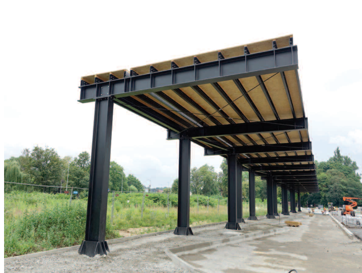
Budowa Centrum przesiadkowego w Nysie