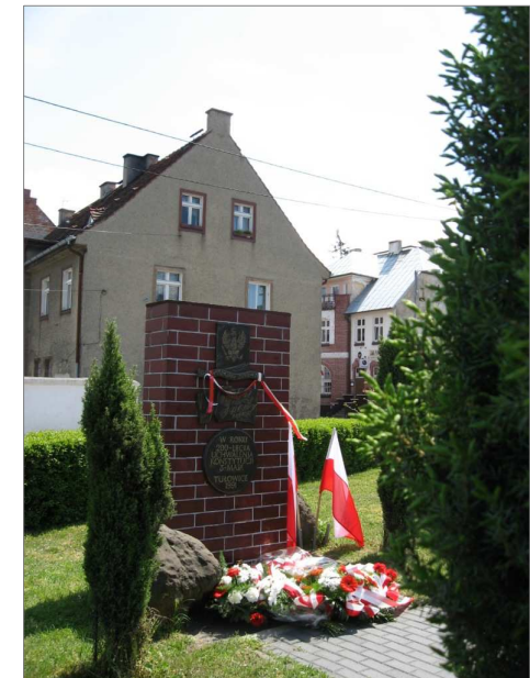
Na zdjęciu – Skwer Konstytucji 3-go Maja w Tułowicach. Tablicę pamiątkową, w roku 200-lecia Konstytucji 3 Maja, odsłonięto 11 listopada 1991 r.