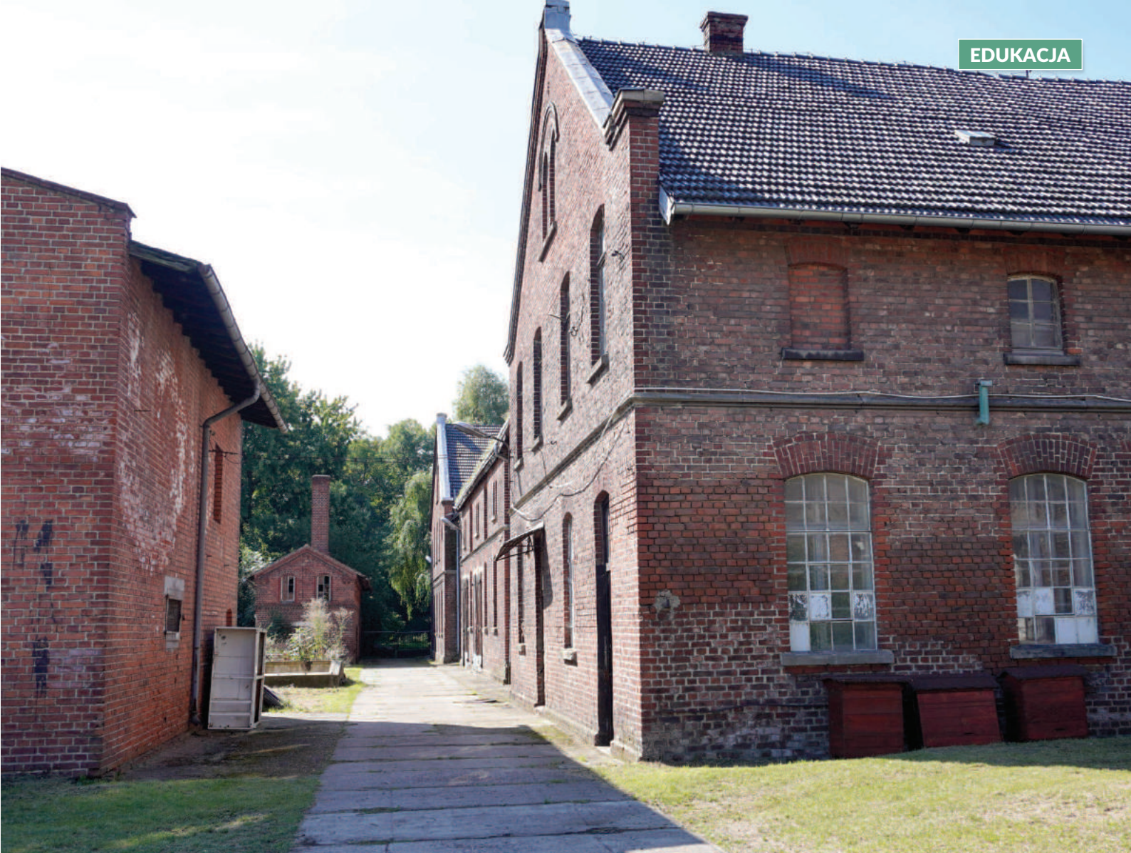
Branżowe Centrum Umiejętności w Nysie powstanie w wyniku przebudowy i adaptacji istniejącej infrastruktury obiektów oświatowych przy ul. Marii Rodziewiczówny

przez Ministerstwo Edukacji i Nauki na wsparcie i budowę 120 Branżowych Centrów Umiejętności. Dofinansowanie pochodzi z Krajowego Planu Odbudowy.