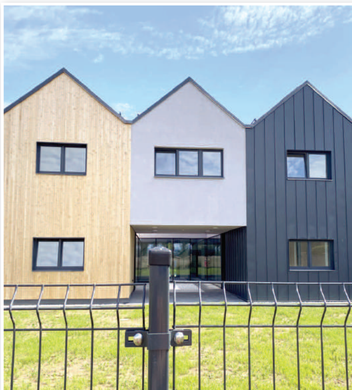
Placówka opiekuńczo-wychowawcza w Nysie