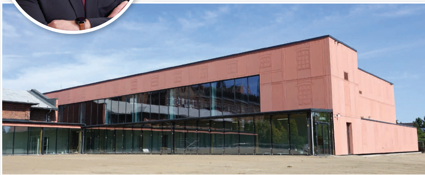
Pełnowymiarowa sala gimnastyczna w Zespole Szkół i Placówek Oświatowych w Nysie