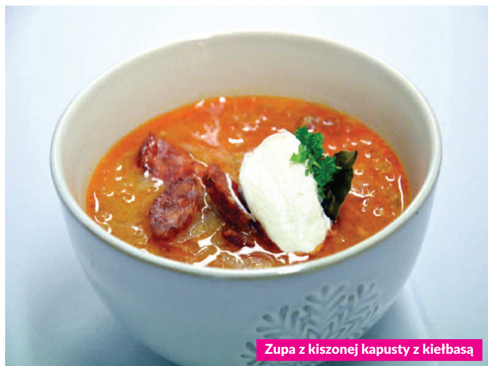
Zupa z kiszonej kapusty z kiełbasą

1. Na smalcu podsmażamy posiekaną cebulę, dodajemy mięso mielone, sól i pieprz. 2. Do podstawy dodajemy mieloną paprykę i ostrą paprykę do smaku, zalewamy bulionem lub wodą i gotujemy. Dodajemy opłukaną kapustę, liść laurowy i pokrojone ziemniaki, gotujemy do miękkości. 3. Zagęszczamy zasmażką z mleka i mąki, gotujemy ok. 20 minut. 4. Do zupy dodajemy podsmażoną kiełbasę i doprawiamy. Na koniec dodajemy kwaśną śmietanę i natychmiast serwujemy.