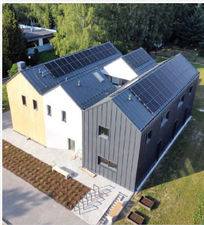
Placówka opiekuńczo-wychowawcza w Otmuchowie