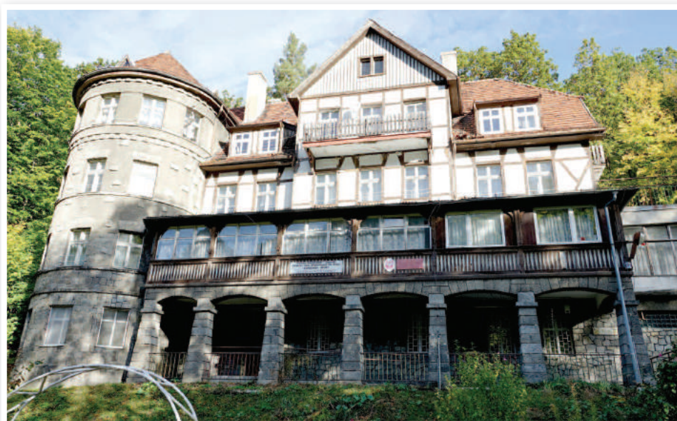
Sanatorium Aleksandrówka w Jarnołtówku