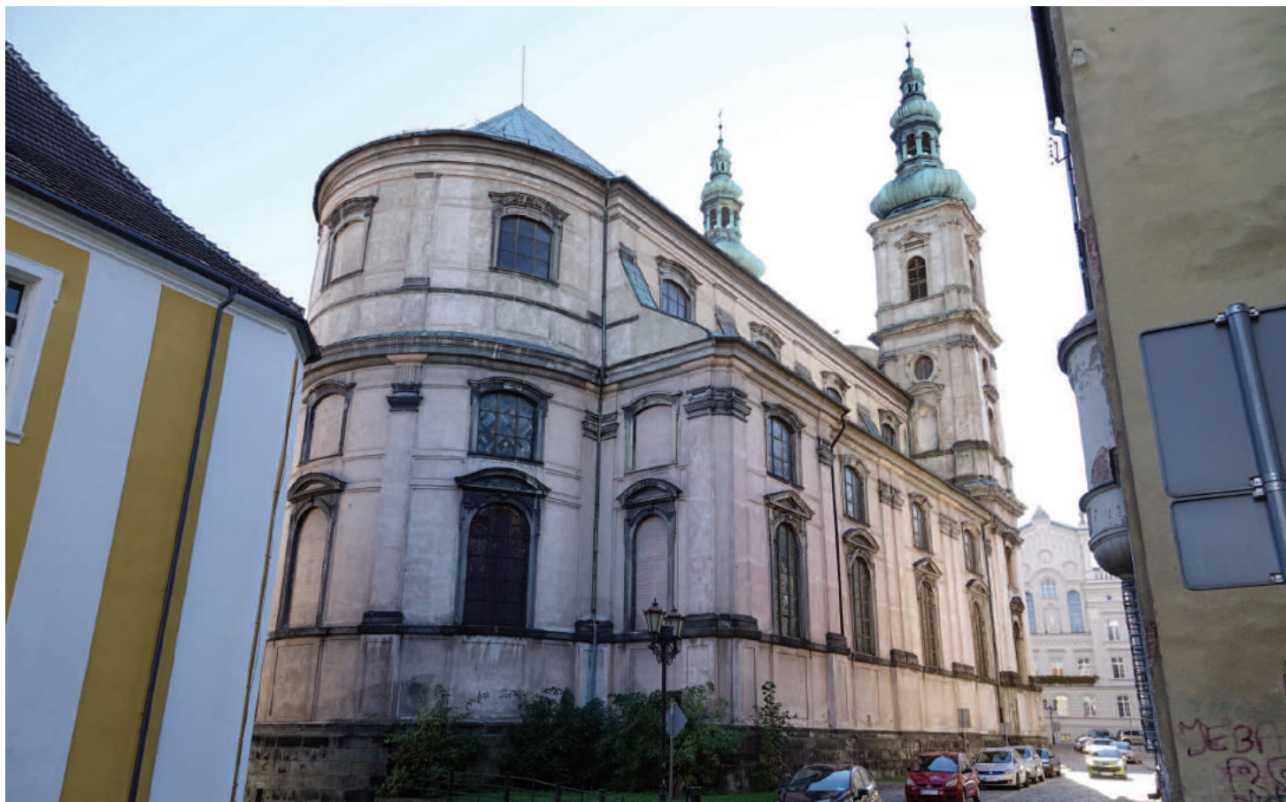
Kościół Wniebowzięcia NMP w Nysie przy Rynku Solnym otrzymał 3 500 000 zł dofinansowania