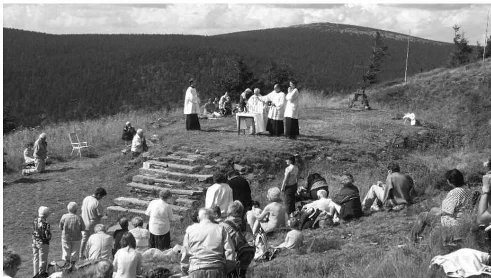
Odpust parafialny na Vřesovej studánce

Na Vřesovej studánce pozostało tylko schronisko i deszczochron nad źródłem. Schronisko, podobnie jak obiekty na Červenohorském sedle, weszło w skład majątku przedsiębiorstwa Raj z Jesenika. Obiekt był stopniowo modernizowany, np. wprowadzono elektryczność, jednak ze względu na szkody powstałe po katastrofie 1921 r. musiano zmniejszyć ilość łóżek, ostatecznie całkowicie je likwidując, prowadząc w schronisku jedynie gastronomię. Ostatecznie schronisko „Vřesová studánka” zostało zamknięte 11 września 1981 r. Co prawda w 1986 r., opuszczony obiekt został sprzedany z zamiarem rekonstrukcji, jednak dwa lata później w 1988 r. schronisko, zagrażające w tym momencie bezpieczeństwu przechodzących obok turystów, zostało rozebrane.