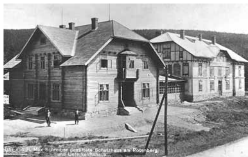
Ufundowane przez Maxa Schreibera schronisko na „Czerwonej Górze”. 1918 r.