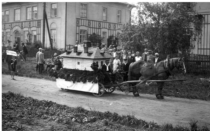
Makieta „Schroniska Jerzego na Šeraku”. 1931

z Ostrawy rozpoczęła budowę, a już po roku, 28 października 1935 r., nastąpiło uroczyste otwarcie. Wybór daty otwarcia, w kolejną rocznicę powstania niepodległej Czechosłowacji, był nieprzypadkowy, gdyż, co raz bardziej dawało się odczuć hitlerowski rewizjonizm zakończony trzy lata później Anshlussem Sudetów. Teraz jednak otwarcie schroniska KČT, było świetną okazją do zmanifestowania czechosłowackiej obecności w całych Sudetach.