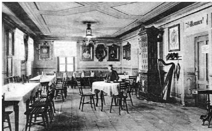
„Schroniska Jerzego na Šeraku” – wewnątrz

budowę obiektu przekazał dwie parcele należące do wrocławskiej diecezji. Kiedy w lutym 1893 r. schronisko spłonęło, odbudowano je po roku, już jako kamienną budowlę, posiadającą 12 pokoi i restaurację. Jeszcze przed I wojną światową zostało przystosowane do turystyki zimowej. W roku 1926 schronisko rozbudowano i zmodernizowano, dzięki czemu miało już 26 pokoi, noclegownię i werandę. W czasach socjalizmu służyło głównie jako restauracja i należało do najczęściej odwiedzanych