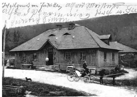
Gościńiec na przełęczy „Čerwonohorské sedlo”

W latach 30-tych, w całych Jeseníkach wzrosła popularność Klubu Czechosłowackich Turystów (KČT), który powstał już w roku 1888, lecz został chłodno przyjęty przez przeważających zdecydowanie na tym terenie Niemców Sudeckich. Dopiero w roku 1929, Klubowi Czechosłowackich Turystów, udało się wydzierżawić część niewielkiego domku, niedaleko niemieckiego gościńca, który spełniał rolę górskiego schroniska. Niestety, jak w wielu podobnych sytuacjach, obiekt szybko przestał wystarczać, dla co raz liczniejszych w Jeseníkach czeskich turystów. W roku 1932, zaczęły się przygotowania do postawienia nowego budynku i wykupiono działkę budowlaną o powierzchni 3 hektarów, a rok później ogłoszono przetarg na jego projekt. Zakładał on wybudowanie wielkiej i reprezentacyjnej siedziby. 25 czerwca 1934 roku, firma braci Špačkových