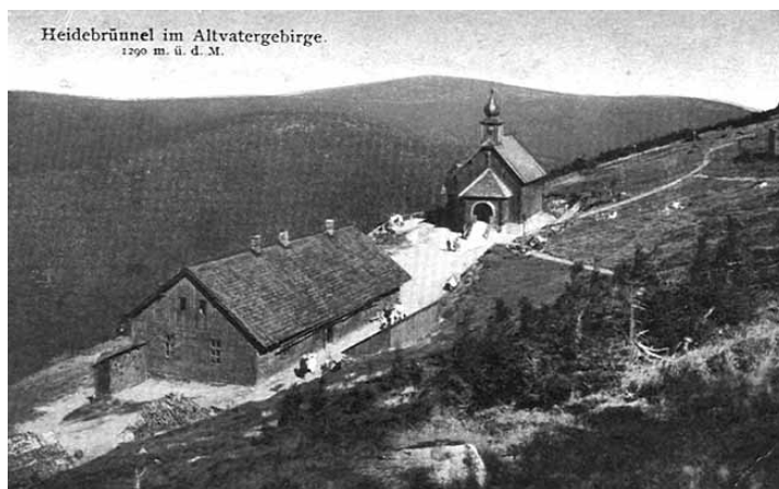
Vřesová studánka. 1927 r.