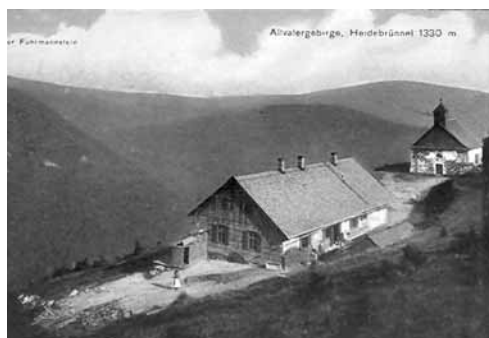
Vřesová studánka. 1892