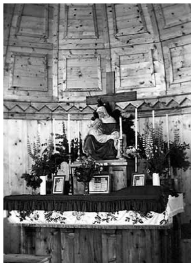
Ołtarz w kaplicy pątniczej we Vřesové studánce